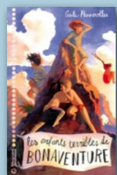
Les enfants terribles de Bonaventure , de Cécile Hennerolles