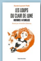
Les loups du clair de lune , de Xavier-Laurent Petit